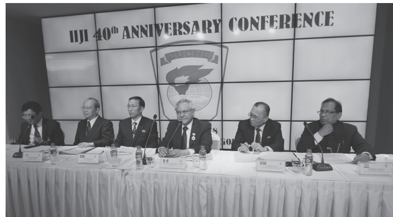
Tribuna presidencial del acto conmemorativo

La fundación del IIIJ fue una declaración orgullosa de avisar lo que el estudio y la divulgación de la idea Juche realizados en varios países por métodos, formas, escalas y niveles con variedad se desarrollarán a