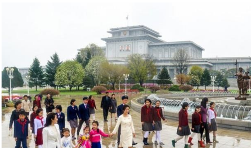
El día 15 de abril de 2024, delante del Palacio del Sol de Kumsusan

socialista y, al mismo tiempo, la fuente de su superioridad y poderío.