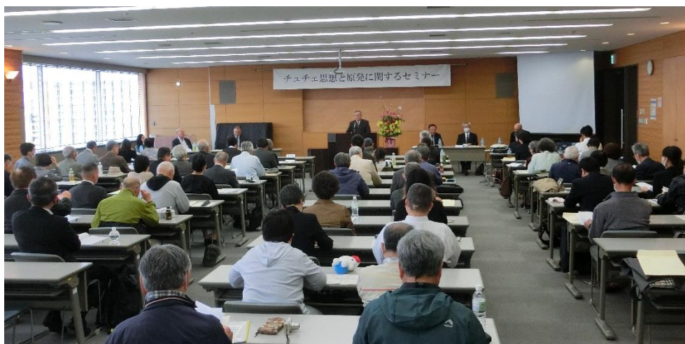
Seminario de la idea Juche y de la central nuclear efectuado el 20 de abril de 2024 en Fukushima, Japón

Intensifiquemos el estudio y la divulgación de la idea Juche en cooperación con diversos países, en estrecha relación con cada continente y también con el Instituto Internacional de la Idea Juche.