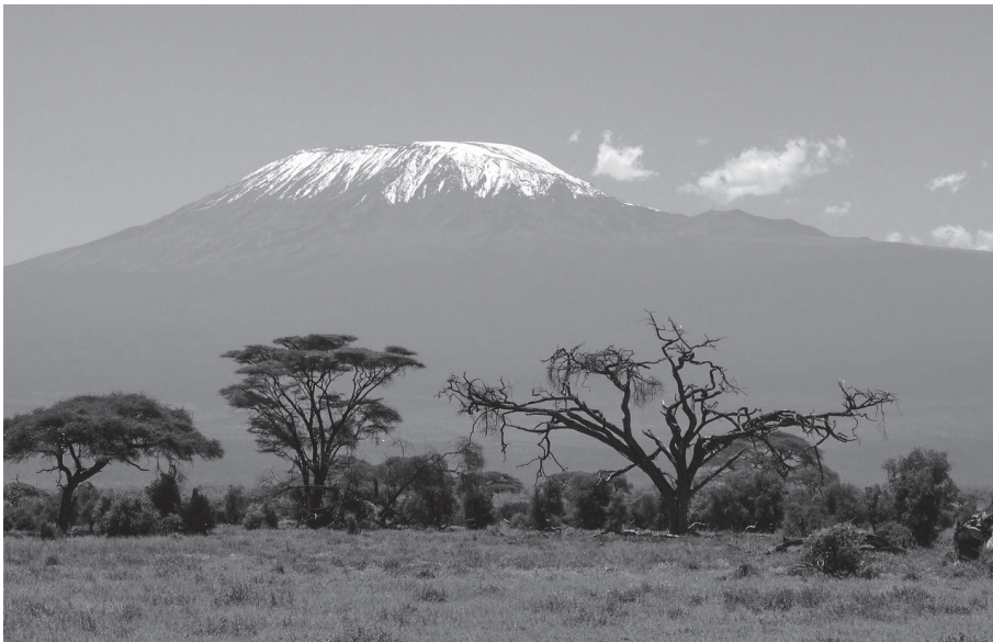
Paisaje grandioso de Tanzania

El desarrollo en países africanos es por y para los pueblos mismos. Tenemos que apoyarnos en las masas populares africanas y movilizarlas a la lucha compenetrándose con ellas para frustrar los mecanismos de los imperialistas y los reaccionarios neocolonialistas, defender la soberanía nacional y la construcción y superar todas las dificultades y obstáculos que encaramos. Las masas populares africanas deben alzar a la lucha por forjar su destino con