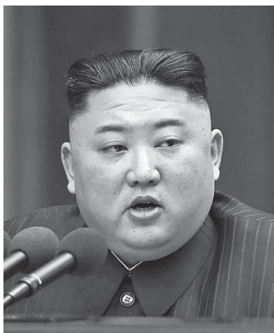
Kim Jong Un