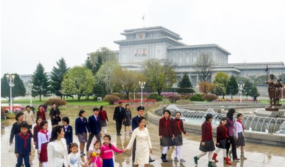
Devant le palais du Soleil de Kumsusan (15 avril 2024)

l'amélioration de la vie populaire en accordant la priorité aux affaires militaires et en surmontant des difficultés.