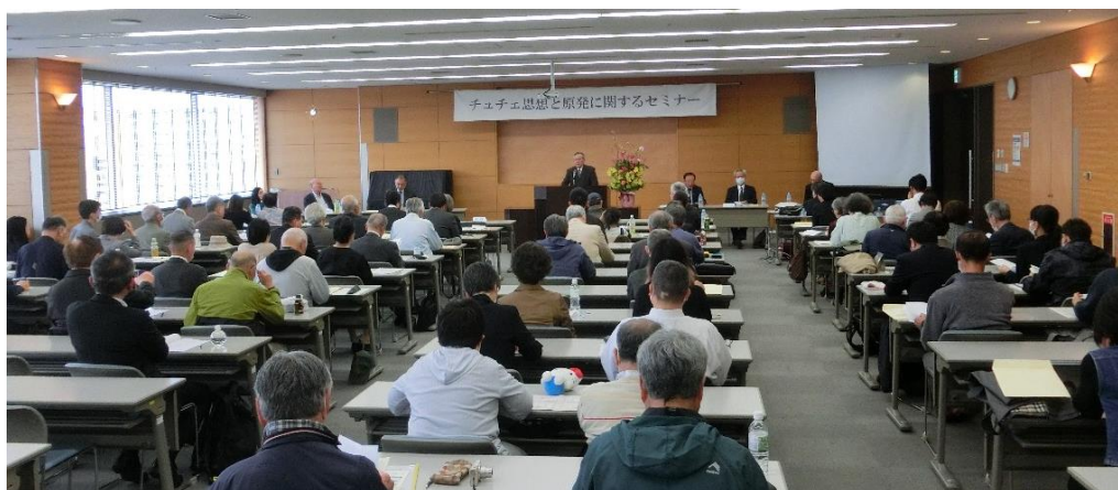
Séminaire sur les idées du Juche et les centrales nucléaires (Fukushima, Japan, 20 avril 2024)

Accélérons l'étude et la propagation des idées du Juche par la collaboration de plusieurs pays, par le lien avec tous les continents et aussi par le lien étroit avec l'IIIJ.